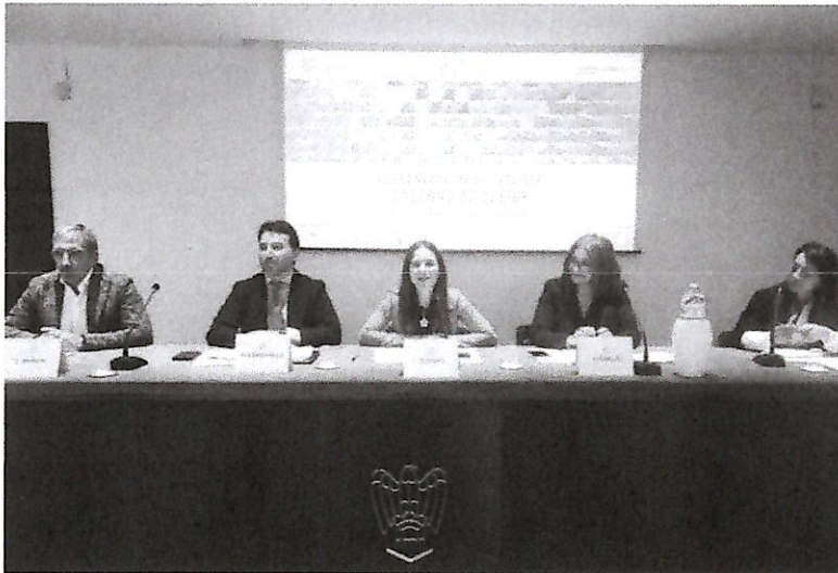
L'incontro di ieri

Ieri mattina ha avuto luogo la presentazione di Salerno Do Design, l'iniziativa realizzata dal Gruppo Design Tessile Sistema Casa di Confindustria Salerno con il sostegno di Camera di Commercio di Salerno - in collaborazione con il Distretto provinciale di Salerno di Confcommercio Campania, Adi delegazione Campania, Accademia Moda e Design di Napoli (IUAD) e Liceo Artistico Sabatini - Menna di Salerno che ha lo scopo di contribuire a sviluppare una riflessione sui temi della creatività e del design. "Siamo giunti alla quarta edizione riscontrando, negli anni, l'interesse del territorio