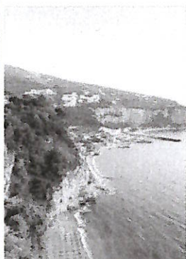
▲ Spiagge. La costa di Vico Equense. Sopra, il litorale di Baia Domizia

Un vessillo in più rispetto al 2023: la new entry è Cellole lungo la Baia Domizia, dopo anni di spiagge negate. Premiate anche gli approdi turistici, da Pozzuoli al Cilento