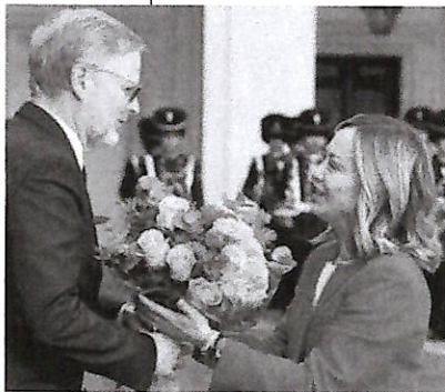
▲ Col premier ceco La presidente del Consiglio, Giorgia Meloni, riceve a Palazzo Chigi il primo ministro della Repubblica Ceca, Petr Fiala

La premier inaugura il comitato che vigilerà sulla spesa del Piano il salviniano Rixi “scarica” Toti e lancia l’allarme: “Rischiamo il blocco dei cantieri”