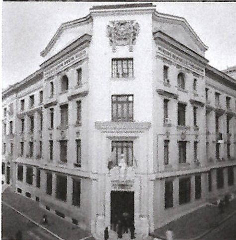
La sede dell’Istat; a destra Valle dell’Angelo, il centro con meno residenti