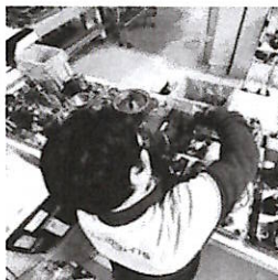
Altra Cassa integrazione A Mirafiori Cig fino al 6 maggio

Byd ha chiuso un'intesa con il governo ungherese per aprire la prima fabbrica auto in Europa e Chery