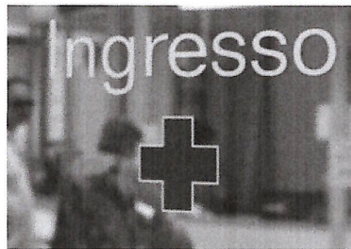
L'ingresso ad una struttura sanitaria pubblica

La sfida si vince se saremo capaci di guardare al futuro, senza temere di operare profondi cambiamenti