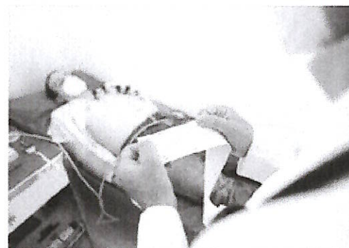
Paziente sottoposti ad un esame