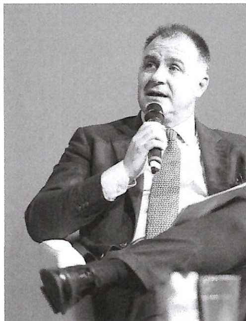
Emanuele Orsini sarà il prossimo presidente di Confindustria

che edita il quotidiano di Confindustria, il Sole 24 ore, sia per la contemporanea iscrizione della sua Erg ad Elettricità Futura e all'Anev, l'associazione nazionale energie del vento sua concorrente. In realtà le due si-