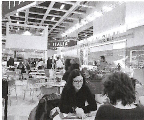
Costa d'Amalfi all'Itb di Berlino

Con questo obiettivo, l'intera Costiera amalfitana è stata promossa, comunicata e presentata come destinazione unitaria nella quale alla conoscenza corretta dei posti più