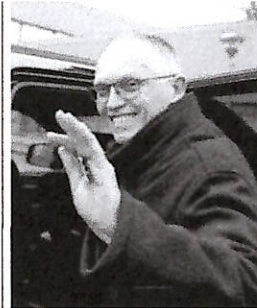
▲ Carlos Tavares Amministratore delegato Stellantis

Il dividendo Il dividendo sarà di 1,55 euro per azione