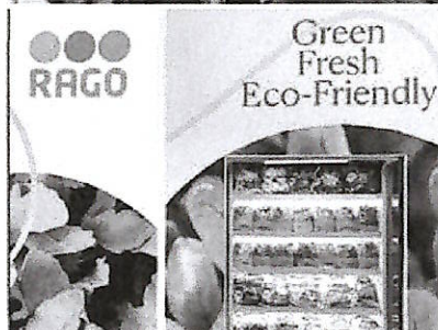
In alto lo stand di Finagricola a Berlino, sopra le relatrici al convegno “Donne e ortofrutta” organizzato da Confagricoltura Salerno e lo stand del Gruppo Rago