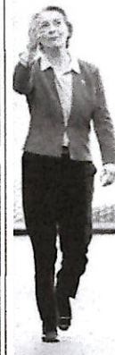
▲ Al vertice Ursula von der Leyen è la presidente uscente della Ue