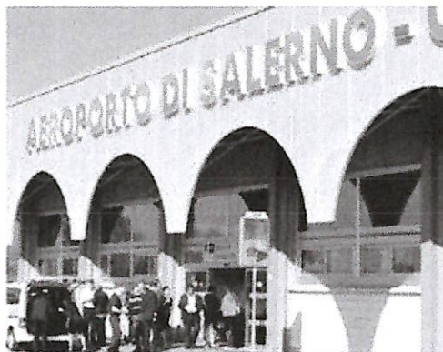
L’aeroporto “Salerno-Costa d’Amalfi”