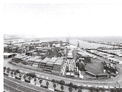
Il porto commerciale di Salerno