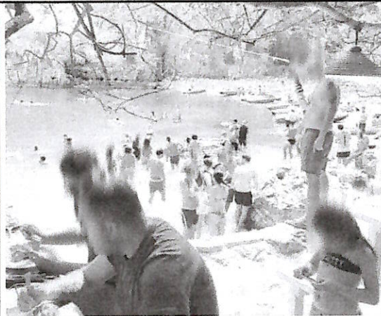
▲ Al mare Un'immagine della spiaggia con i turisti nonostante il divieto

C'è persino chi fitta le sdraio e fa attività di bar e ristorazione ma è tutto abusivo