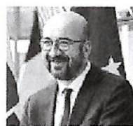
Charles Michel 44 anni

È un fondo garantito dall'Unione europea (nella foto il presidente del Consiglio europeo) e che viene finanziato con l'emissione di «recovery bonds». La dotazione a cui si punta è di 750 miliardi