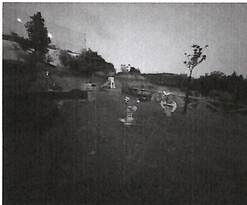
Il parco giochi

È stato inaugurato giovedì sera il nuovo parco giochi dell'Oratorio San Gabriele e Santa Chiara, a Giovi. Una cerimonia più volte rinviata per l'assenza di pubblica illuminazione. Ebbene, il parco giochi inaugurato riscontra oggi lo stesso problema: la sera è impossibile stare nell'area delle giostre proprio per l'assenza di una adeguata illuminazione. Il parco dell'oratorio è stato più e più volte inaugurato in questi anni, come ha ricordato l'esponente di Sinistra Italiana Antonio Santoro: «nuova inaugurazione del Parco delle Pietre Vive a Giovi, già inaugurato il 23 Giugno del 2023. Un anno di abbandono totale con un minimo di manutenzione garantito dai volontari della zona. L'ennesimo luogo della città realizzato per poi essere abbandonato - ha detto Santoro - Uno schiaffo all'intelligenza delle persone libere della nostra città. La vergogna continua». Di fatti, proprio nel mese di giugno 2023 si è tenuta la cerimonia di inaugurazione, l'ennesima, dell'oratorio, realizzato alcuni