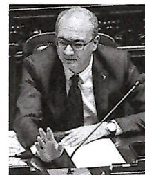
I sindacati della scuola hanno incontrato giovedì scorso il ministro dell'Istruzione Valditara (nella foto) in vista dell'avvio delle trattative

blica non smentisce le nostre cifre, semplicemente usa la narrazione della media del pollo. La verità è che sui primi due anni di vigenza del contratto non ci saranno arretrati; la contrattazione di primo livello (quella che determina gli incrementi di stipendio) è esautorata dall'azione unilaterale e senza confronto operata dal governo con il meccanismo degli anticipi. Tutto questo mentre la propaganda parla di un trattamento d'eccezione e di miglior favore per gli uomini e le donne in divisa. Ma è la stessa musica che riguarda la generalità dei lavoratori pubblici. E per questo continuiamo a mobilitarci per retribuzioni in grado di reggere l'impatto dell'inflazione tornata a crescere». Lo stesso pensiero di fare i ministeriali.