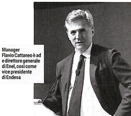
Manager Flavio Cattaneo è ad e direttore generale di Enel, così come vice presidente di Endesa

Dopo il consolidamento degli ultimi decenni, c'è stata una flessione fisiologica negli impieghi. Gli investimenti del semestre, fa sapere ancora Enel, ammontano a 5,279 miliardi di euro, in diminuzione di 763 milioni di euro rispetto all'analogo periodo del 2023 (-12,6%). Gli investimenti effettuati nel periodo sono focalizzati in Enel Grids (2,814 miliardi, ovvero il 53% del totale) e in