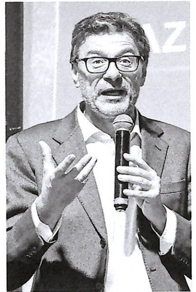
Il ministro dell'Economia e delle Finanze, Giancarlo Giorgetti, entro ottobre avrà parecchio lavoro per evitare che il concordato non abbia successo

lo di un flop del concordato biennale vent'anni dopo l'ultima edizione. Allora il gettito fu appena l'1,6 per cento di quello preventivato, e allora preceduto da un condono fiscale. Questa volta per incrinare le partite Iva ad aderire il viceministro alle Finanze Maurizio Leo ha introdotto tutti gli sconti possibili: niente controlli per il passato e il futuro, una tassa piatta per gli incrementi di guadagno.