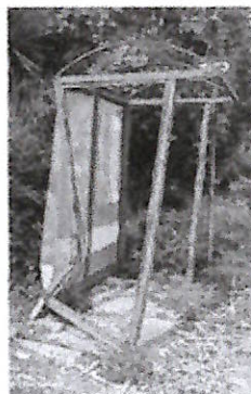
Una delle pensiline