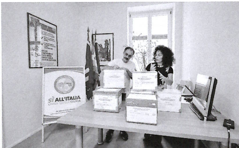
▲ Raccolta Alcuni plichi con le firme per il referendum abrogativo arrivati nella sede della Cgil di via Toledo