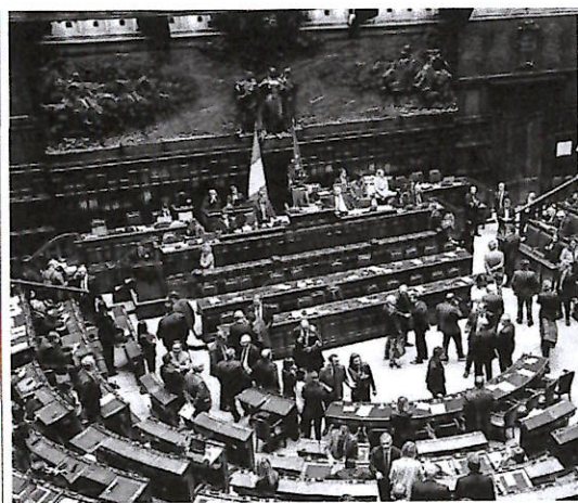
▲ Montecitorio Una pausa durante una seduta della Camera dei Deputati

I firmatari dell'appello spiegano poi quali sono i contenuti del Disegno di legge approvato alla camera della maggioranza che sostiene Giorgia Meloni: "Vengono reintrodotti le pene corporali come nelle camere di tortura degli assolutismi, delle teocrazie, delle inquisizioni e dei fanatismi religiosi. Per coprire smacchi e fallimenti nel garantire tranquillità e vita serena per tutti i cittadini, mettendo in condizioni le strutture e i servizi dello Stato di adempiere ai propri compiti in condizioni adeguate, si aumentano a dismisura le pene e si colpiscono diritti fondamentali della persona come quello di comunicare ed esprimersi".